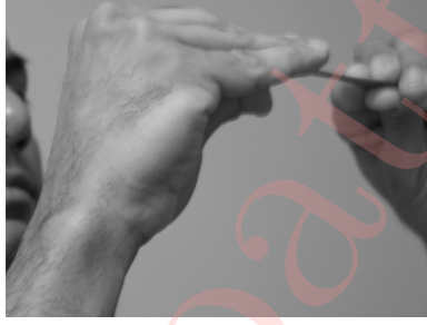
Figure 2: Covering a spoonful of water from pūrṇakumbham and raising up to the level of the nose.

and pour this water back into the पूर्णकुम्भम् (vessel no. 1).