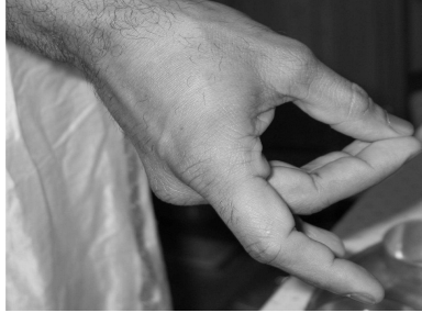
Figure 4: Configuring grāsa mudrā with your right hand.

and undo the ग्रासमुद्रा configuration. Again configure the ग्रासमुद्र and move from each item you wish to offer the Lord and recite the appropriate offering mantra and undo the ग्रासमुद्रा configuration. For example,