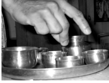
Figure 8: Snapping above the vessel.

to the IUC, showing the सुरभि मुद्रा to the IUC and performing the अस्त्रमन्त्रं over the IUC will be referred to as शोषणं-दाहनं-प्लावनं-सुरभिमुद्रा-अस्त्रमन्त्रं to that IUC, for brevity.