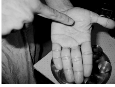
Figure 6: Scribing vam on your left palm with the right index finger.

Develop the सुरभि मुद्रा on your hands as shown in Figure 7. This is done by touching your left little and right ring fingers, left ring and right little fingers, left index and right middle fingers, and left middle and right index fingers.