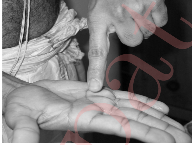
Figure 5: Scribing yam on your right palm with the left index finger.

Either imagine the word यं written on your right palm or scribe the word यं, in the script you are comfortable with, on your right palm with your left index figure, as shown in Figure 5.