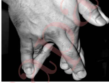
Figure 7: Configuring surabhi mudrā with the right hand.

Develop the सुरभि मुद्रा on your hands as shown in Figure 7. This is done by touching your left little and right ring fingers, left ring and right little fingers, left index and right middle fingers, and left middle and right index fingers.