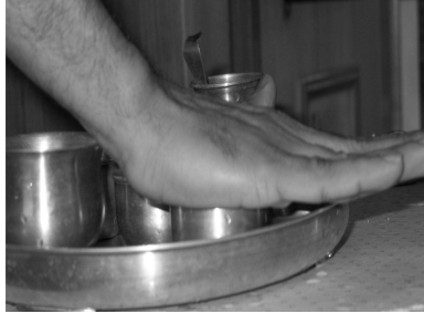
Figure 3: Covering the vessel with your right palm.